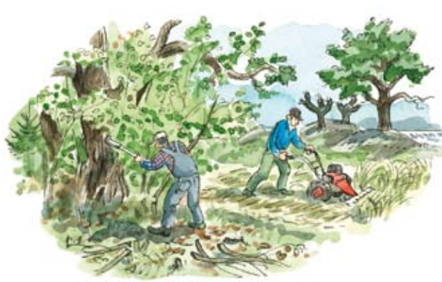
När skötseln upphörde växte markerna igen. Återställning av det gamla kulturlandskapet krävde mycket arbete.

Först 1943 skrevs ett åtgärdsförslag för Ängsö som resulterade i omfattande röjningar, lieslätter och bete. Men efter några år flyttade den dåvarande bonden med sina djur från ön och markerna blev åter utan skötsel. På 1950-talet anställdes en tillsynsman, markerna röjdes, slåttern återupptogs och betesdjur kom åter till ön. Ekonomibygnaderna byggdes ut och rustades upp.