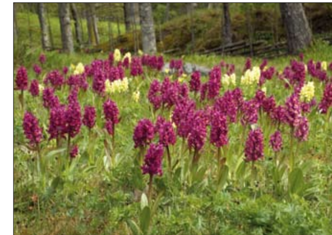
Adam och Eva ( Dactylorhiza sambucina )