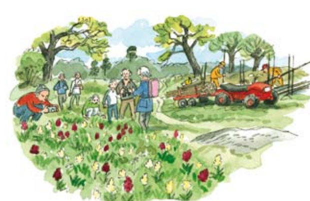
Slätterbalk och fyrhjulning har nu ersatt lie, häst och en del av bondens oändliga slit. Målet är att bevara ett artrikt, äldre odlingslandskap.

Blomsterprakten är häpnadsväckande. Under våren är markerna översållade med gullvivor och i fuktiga partier av Långängen växer rosa majvivor. Några andra blommor i ”Ängsöbuketten” är höskallra, kungsängslilja, ramslök och vårärt. Tänk bara på att du inte får plocka dem!