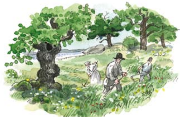
Slätter har under århundraden format Ängsös vackra landskap och örtrika blomsterängar.

Slätter har troligen bedrivits på Ängsö sedan medeltiden. Då bestod Ängsö av två mindre öar och i det grunda sundet mellan öarna skördades vass. Men landhöjningen innebar att vassen ersattes av gräs- och örter, och vid slutet av 1700-talet förenades öarna till en ö.