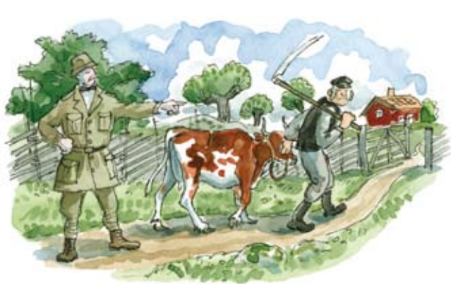
När Ängsö blev nationalpark fick torparen inte längre slå ängarna. Det blev inledningen till en av Sveriges största naturvårdsskandaler.