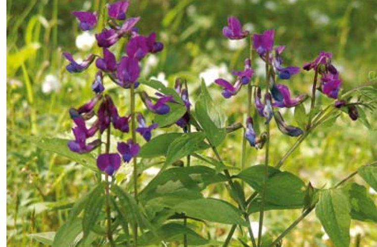
I maj månad blommor vårärt ( Lathyrus vernus ).