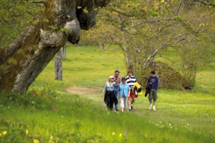
Ängsö är välbesökt och känd för sitt ålderdomliga landskap med blommande slätterängar, lummiga lövskogar och idyllisk torpbebyggelse.