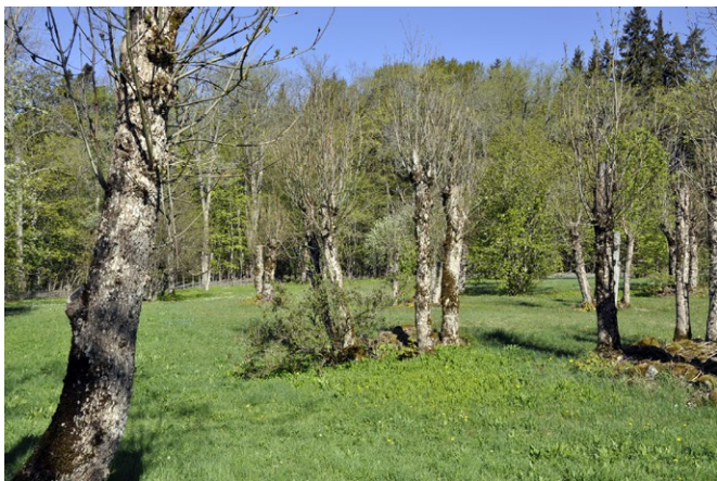
De hamlade (beskurna) träden har satt nya skott.

Nu hålls de gamla åkermarkerna öppna med årlig slåtter i augusti, då alla örter blommat över. Förr samlades även kvistar med löv från de träd och buskar som fanns runt gårdarna och i ängs- och betesmarkerna. I slutet av 1980-talet genomfördes ett experiment på ca 200 lövträd. Istället för att hugga ner träden kapades de av högt upp på stammen. Många av träden överlevde och liknar idag de träd som sköts traditionellt med återkommande beskärning (hamling). Trädens skott beskärs med fem till tio års intervall.