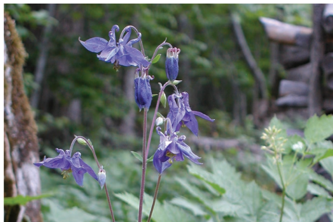
Aklejan är ett minne från Östra gården som tidigare låg på platsen.

Omkring år 1870 kalhöggs nästan all skogsmark som hörde till Östra gården. De avverkade träden blev kolved som användes till bränsle vid järnhanteringen. På många ställen i skogen går det att upptäcka gamla kolbottnar, rester efter de kolmilor där veden kolades till träkol. Idag får skogen utvecklas fritt för att med tiden resultera i en skog med olika trädarter, gamla och döda träd. En skog där många av dagens hotade växter, djur och svampar trivs.