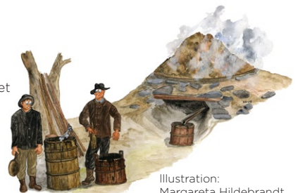
Illustration: Margareta Hildebrandt

Tjärbränning var en viktig inkomstkälla för folket i Tivedsbygden från 1600-talet och långt in på 1800-talet. Tjärans utvanns av kådrik tallved som sakta brändes i en tjärdal som kunde vara upp emot 10 meter lång och en meter bred.