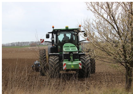
Traktor på en åker