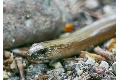
Orm eller ödla