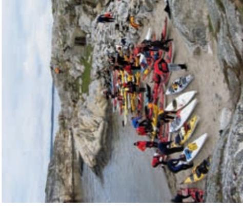
Tisler, Ytre Hvaler